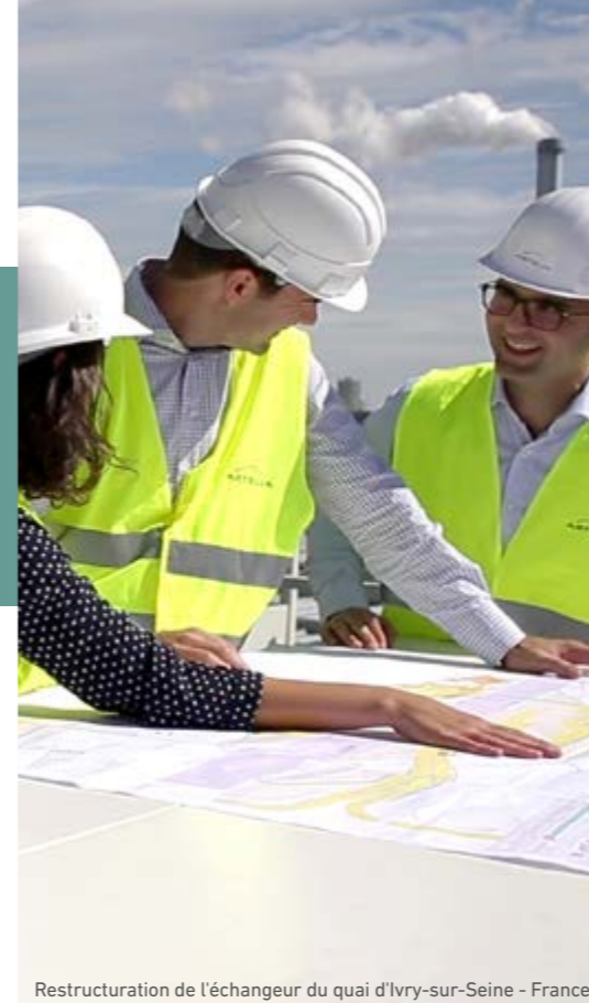
Restructuration de l'échangeur du quai d'Ivry-sur-Seine - France

Le azioni di patrocinio devono essere registrate nella contabilità della società del Gruppo interessata ed essere segnalate al Rappresentante Etica e Integrità del Gruppo e delle unità operative.