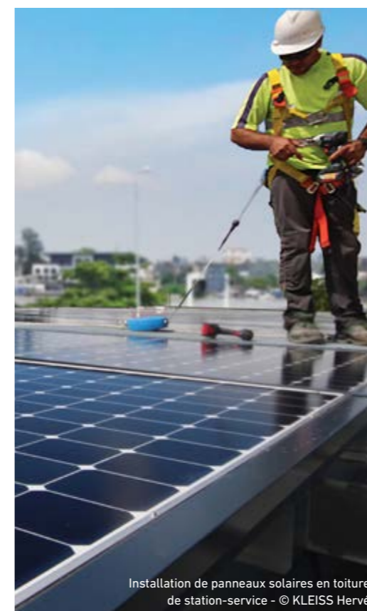
Installation de panneaux solaires en toiture de station-service

Artelia ritiene inoltre che gli approcci commerciali debbano essere condotti in conformità al principio della concorrenza leale e proibisce qualsiasi accordo o comportamento che possa essere definito come pratica anticoncorrenziale.